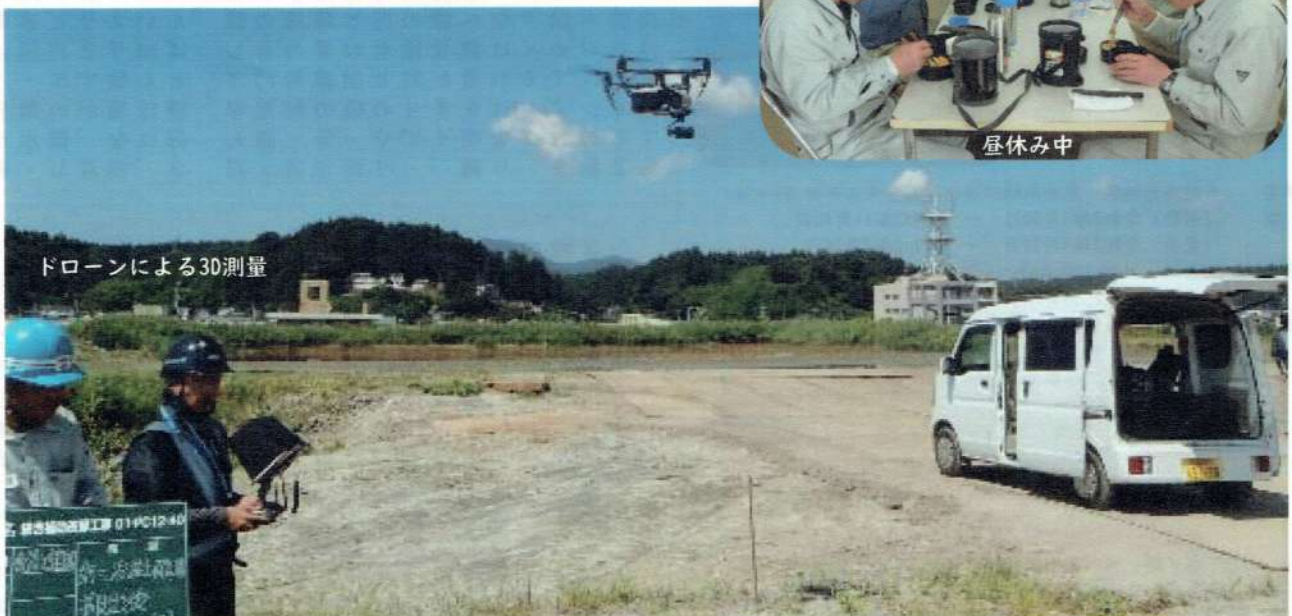
ドローンによる3D測量